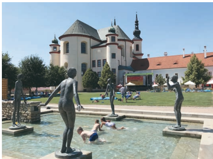
Fontána s plastikami Olbrama Zoubeka v Kláštorňých záhradách.