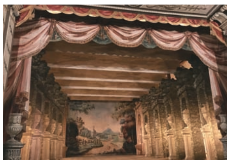
Cenné Zámcké divadlo z roku 1797.