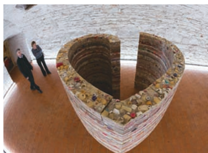
Pohľad na Srdce zhora.