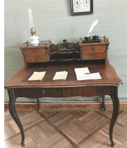
Pracovný stôl Bedřicha Smetanu.

Zámok dal vybudovať v 16. storočí Vratislav z Pernštejna, poslednými majiteľmi, ktorí v zámku bývali, boli Valdštejnovci. Prehliadka zámku je zážitok. Začína sa v unikátnom zámokom divadle z roku 1797, ktoré je dnes európsky významnou pamiatkou, pretože sa zachovali už len tri ďalšie pôvodné divadielka