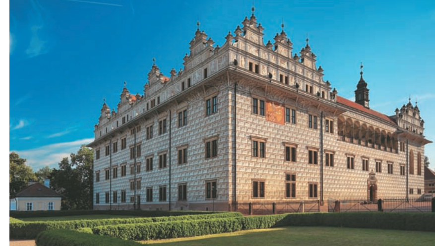
Renesančný zámok s 8 000 listovými sgrafitami je hlavným magnetom Litomyšľa.