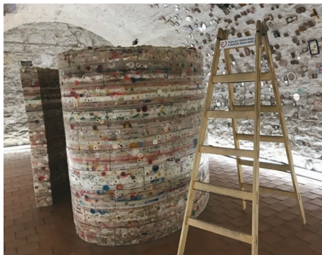
K Srdcu pre Václava Havla z dvoch ton sviečok treba vyliezť po rebríku.