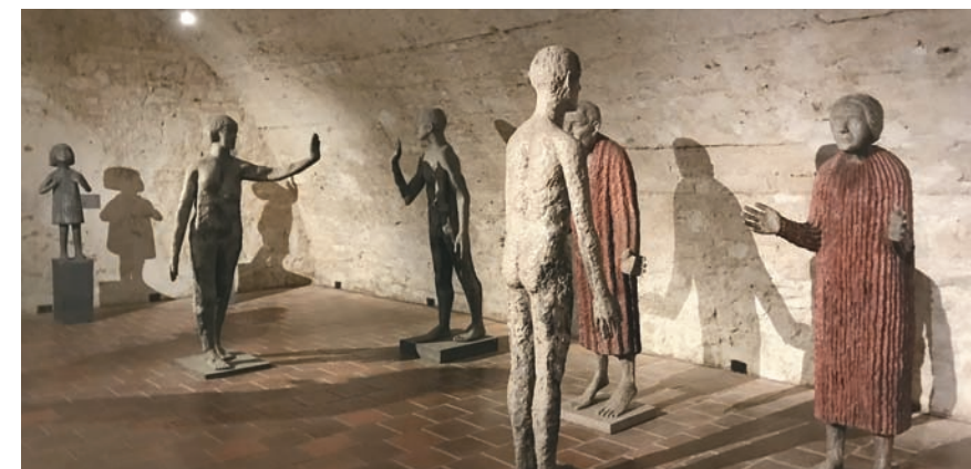
V zámokom podzemí vystavujú veľkú kolekciu sôch Olbrama Zoubeka.