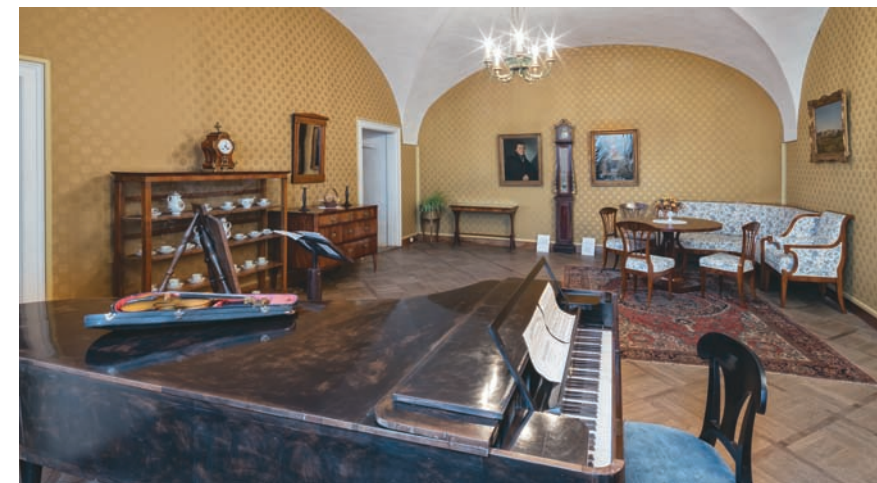
Originálny klavír, na ktorom hrával Bedřich Smetana v ich byte v zámokom pivovare.