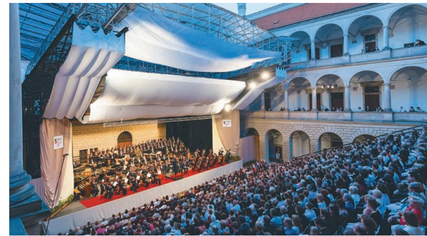
Smetanova Litomyšl je druhý najstarší hudobný festival v Česku. Koná sa na nádvoří zámku.