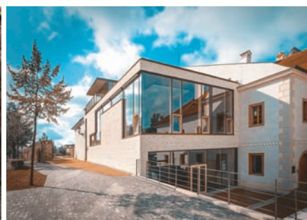
Moderná prístavba k Piaristickému kolégiu.

venoval „svoju“ mestu. Galéria v podzemí zámku tak získala náplň, ktorá sa skvele snúbí s pivničnými priestormi. K prehliadke návštevníkovi okrem audiosprievidcu, kde sám sochár rozpráva o svojich dielach, ponúknú aj pohár vína. Apropos, sám rodený Pražan Olbram Zoubek tvrdil, že z porovnania Prahy a Litomyšľa vychádza víťazne Litomyšľ: „Posúďte sami. Praha je dosť presne stokrát väčšia než Litomyšľ. Zišlo sa niekedy v Prahe sedemsto prezidentov? Má Praha sto zámckých areálov zapísaných v zozname UNESCO? Navštívilo Prahu sto španielskych kráľov? Preto mám rád Litomyšľ, mesto Smetanu, Jiráska, Boženy Němcovej a Dobromily Rettigovej. Je mi tu dobre.“ V apríli 1994 pozval vtedajší prezident Václav Havel šesť stredoeurópskych prezidentov na zámok Litomyšľ.