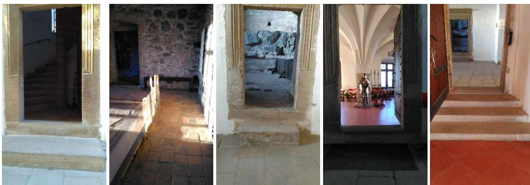
Zleva: Schodiště do vyšších pater, prostor druhého patra, vstup do severního křídla paláce, vchod do Rytířského sálu, východ z Rytířského sálu