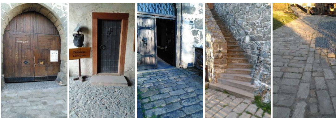
Zleva: Hlavní brána (vstup k pokladně a na nádvoří), vchod do pokladny, vchod do hradního paláce, schody do kaple, povrch nádvoří