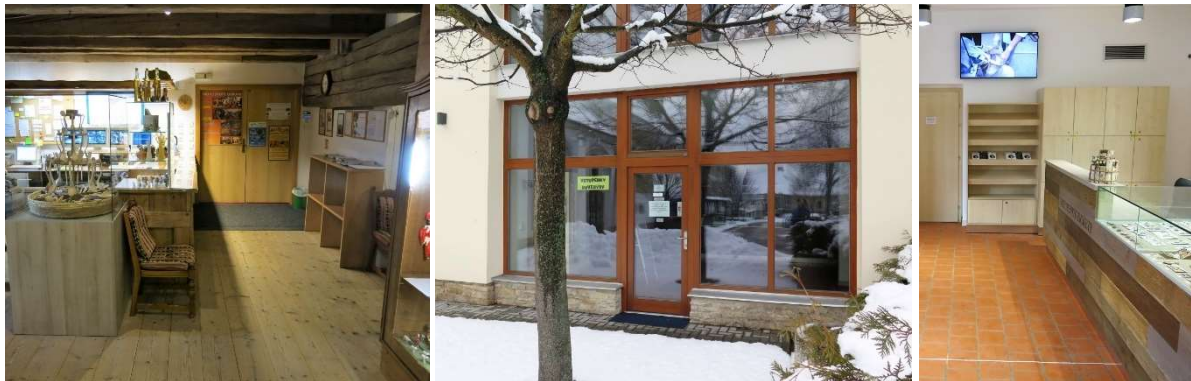
Od lewej strony: Kasa główna do trasy A (na 2, piętrze), kasa boczna z centrum informacji (wejście i wewnątrz)