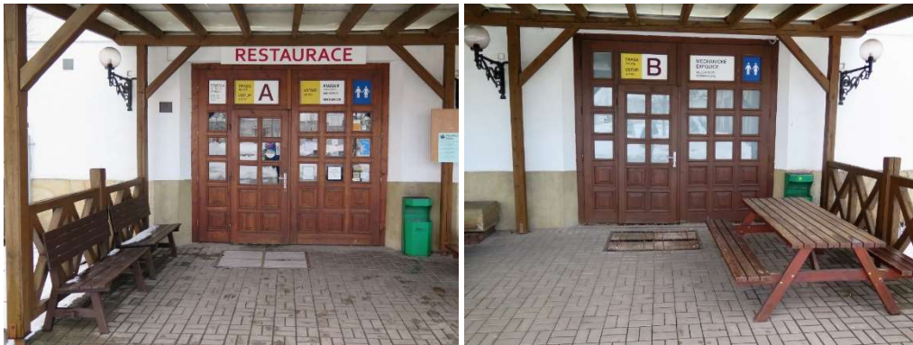
Od lewej strony: Wejście na trasę zwiedzania A i B