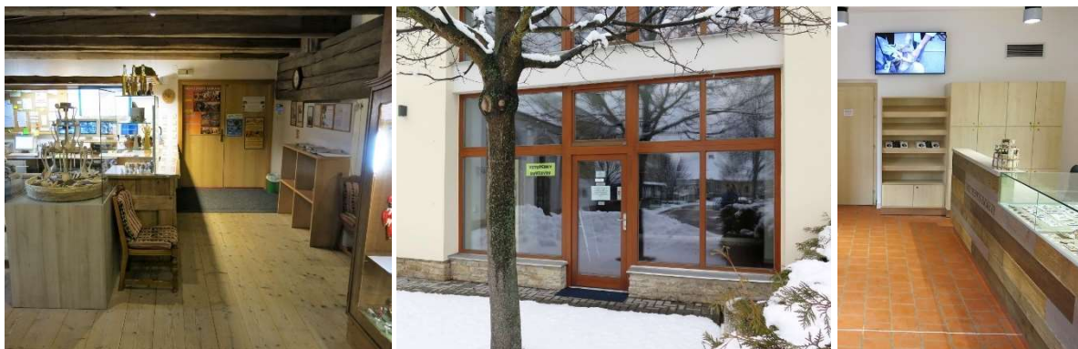
Zleva: Hlavní pokladna na trase A (v 2. NP), vedlejší pokladna s informačním centrem (vstup a interiér)