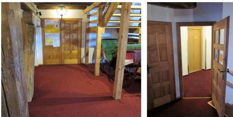
Zleva: Komunikační cesty v interiéru (přístup k expozici A), přístup k výtahu ve 2. podlaží na trase A