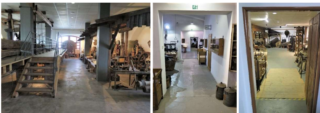
Zleva: Expoziční prostory prohlídkového okruhu B, komunikace na trase B, šikmá plošina na trase B