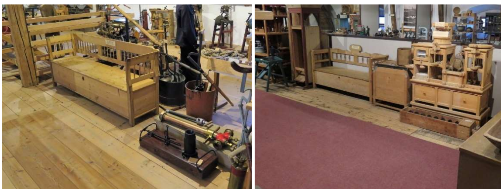
Expoziční prostory prohlídkového okruhu A