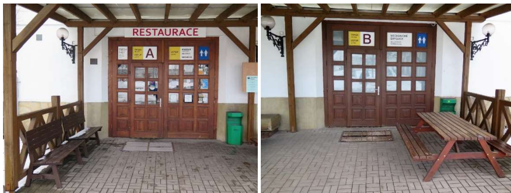
Zleva: Vstup na prohlídkový okruh A a B