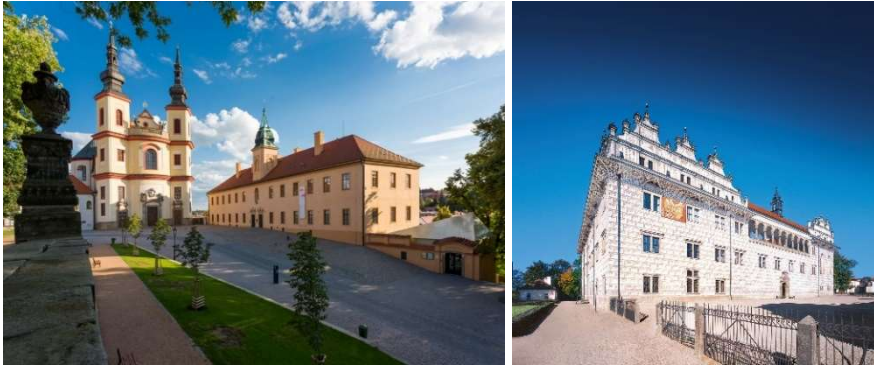
Od lewej strony: Zámecké návrší (Wzgórze Pałacowe), pałac