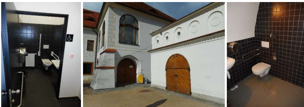
Od lewej strony: WC Smetanovo náměstí, budynek WC w Ogrodach Klasztornych, WC w ogrodach Klasztornych