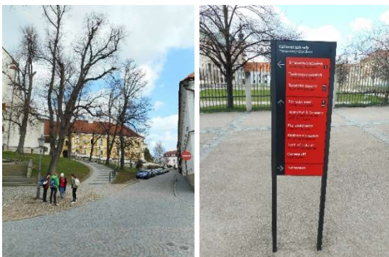
Od lewej strony: Kościół Podwyższenia Krzyża św. i droga na rynek, oznaczenia w mieście