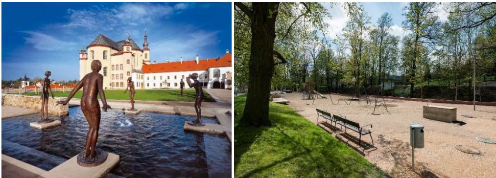
Od lewej strony: Ogrody Klasztorne, park Vodní valy