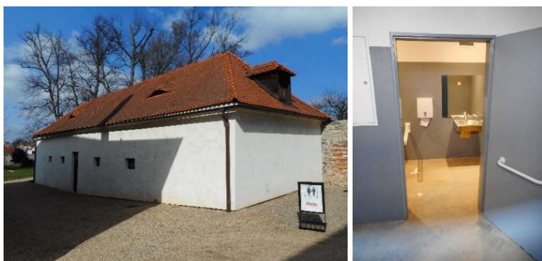
Od lewej strony: Budynek WC na obszarze kompleksu pałacowego, wejście do kabiny toaletowej bez barier architektonicznych – kompleks pałacowy